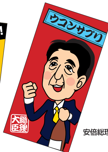
安倍総理イメージ案