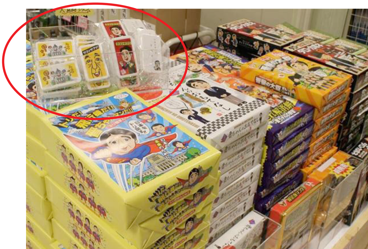
産経新聞11月28日掲載記事『「アベノミヤゲ」高支持率 政治家土産物商戦 自民の独り勝ち』より転載 安倍晋三首相など自民党の政治家を題材にした菓子が並ぶおかめ堂＝東京都千代田区の衆院第2議員会館

安倍総理の似顔絵と国会議事堂イラストが、ウコンサプリケースに採用され11月上旬から東京・永田町の衆院第2議員会館内の土産物店「おかめ堂」にて販売されています。産経新聞11月28日の『「アベノミヤゲ」高支持率 政治家土産物商戦 自民の独り勝ち』によると、『衆院解散後も2回にわたって150個の追加発注をかけた。』とのことで最近の売れ筋商品となっているそうです。