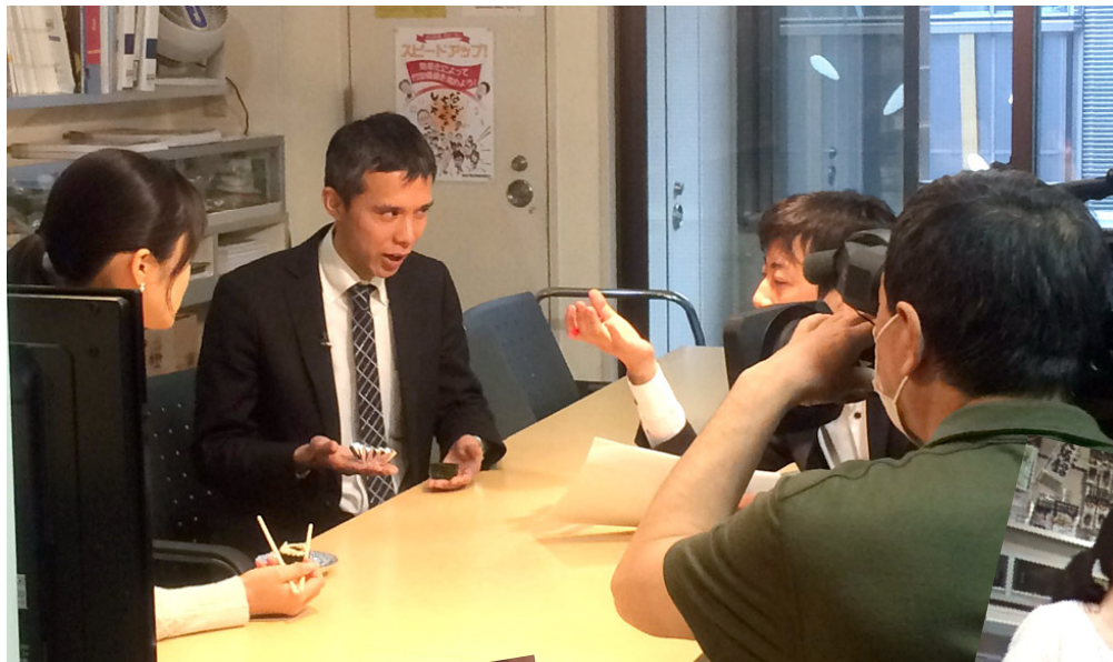
東京オフィスでの 取材風景。