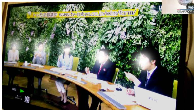
スタジオでも各種うつわを試食されていました。