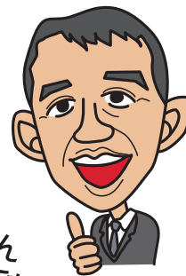
堀越さん テレビデビューです♪