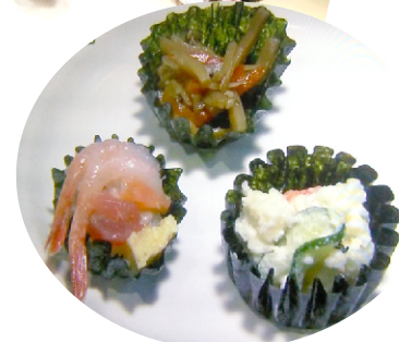
いろんな具材を乗せて試食を。