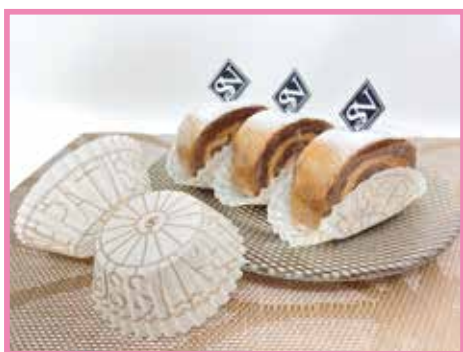
フレンチホイール白 8F使用

色付きの紙製品に付きましては、使用用途(焼成や冷凍など)によって食材に色がる場合が有りますので、ご使用の際には一度試作してご検討願います。