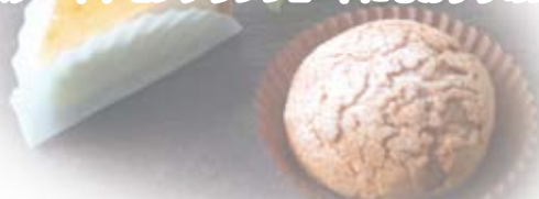
クッキーシュー/CSEチョコ17A

色付きの紙製品に付きましては、使用用途(焼成や冷凍など)によって食材に 色がる場合が有りますので、ご使用の際には一度試作してご検討願います。