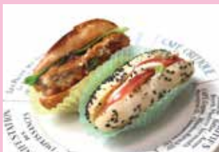
・フィッシュフライのロールパン ・クリームチーズとトマトの黒ごまロールパン