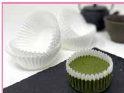
両面シリコン紙ケース 9F