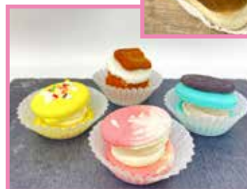
両面シリコン紙ケース 7F