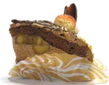
トラッドフレンチ17A使用