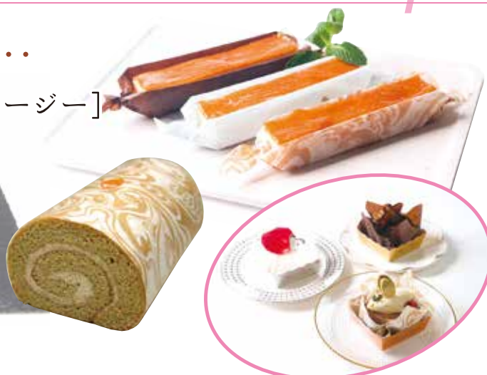
スティックチーズケーキやロールケーキの生地の乾燥防止にも!