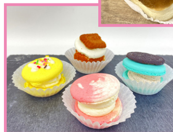
両面シリコン紙ケース 7F