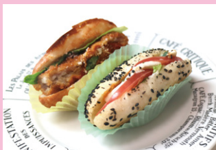
・フィッシュフライのロールパン ・クリームチーズとトマトの黒ごまロールパン