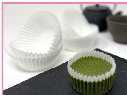
両面シリコン紙ケース 9F