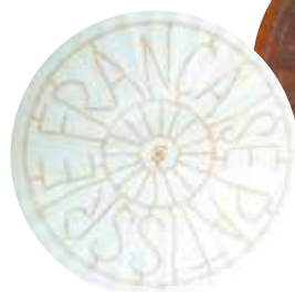
フレンチホイール白