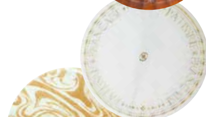
パティスリー (8Fのみ)